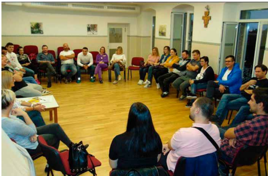
Radionice u jasticama i vrtiću "Mima" 2019.